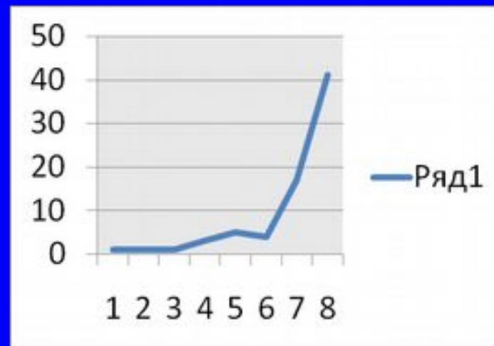
Кількість науково-педагогічних працівників, задіяних у виставковій діяльності